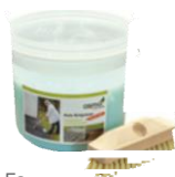
Fa- élenkítő intenzív gél