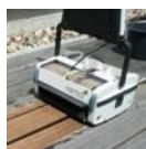
Terasz- és padlótisztító gép